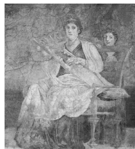
8. Grająca na gitarze. Fragment fresku z Villa Boscoreale, ok. 40-30 r. p.n.e.

Lira, także należąca do tej rodziny instrumentów, obecna już co najmniej od XVIII w. p.n.e. na terenach Syrii i Anatolii, zyskała w pewnym momencie ogromną popularność i stała się instrumentem najsłynniejszego poety i muzyka starożytności – Orfeusza (podobnie zresztą jak jego ojca – boga Apolla). Ślad po tej popularności znajdujemy jeszcze w tytule XVI-wiecznego zbioru Orphénica Lyra autorstwa hiszpańskiego vihuelisty i kompozytora Miguela de Fuenllana.