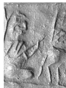
1. Fragment pieczęci cylindrycznej z Uruk, ok. 3500-3200 p.n.e., British Museum BM 141632

Jeden z powstałych ok. 13 tysięcy lat p.n.e. rysunków naskalnych w jaskini Trois Frères we Francji przedstawia najprawdopodobniej człowieka grającego na łuku. W Afryce Południowej wśród niektórych ludów do dzisiaj gra się na łuku muzycznym. Zgodnie z klasyfikacją Hornbostela-Sachsa, stworzoną na początku XX w., lutnie to instrumenty strunowe składające się z korpusu oraz szyjki, w których struny ułożone są równoległe do płyty rezonansowej, a więc także gitara, skrzypce i wiola. Najnowsze badania wskazują, że instrumenty strunowe w typie lutni były używane wśród indoeuropejskich ludów: Hetytów,