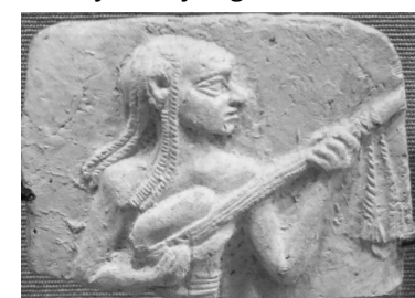
2. Tabliczka z Ischali, okres Isin-Larsa (2000-1600 p.n.e.)

Hurytów i Kasytów, a następnie za ich pośrednictwem trafiły do Mezopotamii. Obecnie były także w prastarej kulturze sumeryjskiej – najstarszej w tym regionie. Z mezopotamskiego Uruk pochodzi najwcześniejsze znane przedstawienie lutni, które datuje się na IV tysiąclecie p.n.e.