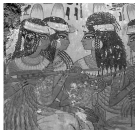
5. Fragment fresku z grobowca Nebamuna w Tebach, ok. 1350 p.n.e.

Także w Egipcie na pewno od okresu Nowego Królestwa (XVI–XI w. p.n.e.) używano długoszyjkowych lutni o dwóch lub trzech strunach, z niewielkim pudłem rezonansowym, czasem wykonanym ze skorupy żółwia. Do szarpania strun używano zarówno plektrum (przywiązanego do instrumentu), jak i palców. Gryf był zaopatrzony w progi, choć niewykluczone, że wcześniej ich nie używano. Struny wytwarzano ze zwierzęcych jelit, nie używano kołków – struny były związane i zwinięte na końcu gryfu; interesujące przedstawienie lutnistki strojącej instrument znajdujemy na fresku z grobowca w Rekhmirie.