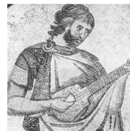
12. Fragment mozaiki z palatium w Konstantynopolu, ok. VI w.

Kiedy w VIII w. Arabowie podbili Półwysep Iberyjski i utworzyli Al-Andalus (muzułmańskie państwo zajmujące większą część dzisiejszej Hiszpanii), kultura arabska – głównie przez Prowansję i działalność trubadurów i truverów – rozprzestrzeniła się na resztę Europy. Tak też było z instrumentami muzycznymi: przede wszystkim oud – arabską odmianą lutni bez progów (po