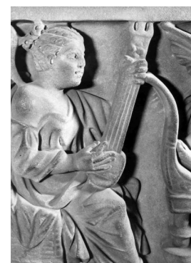
11. Płaskorzeźba z rzymskiego sarkofagu z III w.

używali chętnie instrumentów lutniowych. W mieście Bizancjum (obecnie Stambuł) przemianowanym przez Konstantyna I na Konstantynopol, leżącym na przecięciu szlaków handlowych, mieszały się wpływy ze wschodu i zachodu. Ważną trasą handlową łączącą to miejsce z Europą był także Dunaj, który miał ujście w Morzu Czarnym.