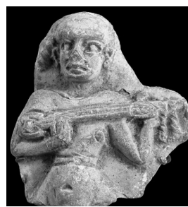
6. Elamicka figurka z ok. XIV-XIII w. p.n.e.

W starożytnym Egipcie instrumenty szarpiane bardzo często występowały w zespołach wraz z fletami, harfami, perkusjonaliami i towarzyszyły bankietom, procesjom, tańcom, ale także rytuałom.