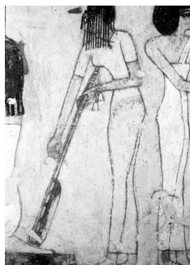
4. Fragment fresku z grobowca w Rekhmirie, ok. XVI-XIII w. p.n.e.

W Alacahöyük (dzisiejsza Turcja) znaleziono płaskorzeźbę pochodzącą z XIV w. p.n.e., na której przedstawiony jest hetycki muzyk grający na instrumencie o pudle rezonansowym z wcięciami charakterystycznymi dla gitary.