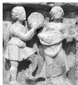
9. Scena bankietowa, płaskorzeźba z Gandhary, I w.

Nazwa kitara pojawia się w VII w. p.n.e. i jest grecką wersją liry – z płaskim drewnianym pudłem rezonansowym. W wersji łacińskiej nazwa brzmi cythara . W Gandharze (tereny dzisiejszego Pakistanu i Afganistanu) używany był przez Persów instrument lutniowy nazywany barbat lub barbud , który jest poprzednikiem późniejszej arabskiej oud i mniejszej od niej quitra (używanej do dziś w Algierii).