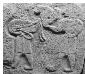
3. Fragment płaskorzeźby z Alacahöyük, XIV w. p.n.e.

Aż do XX w. świat nie był zunifikowany, a nazwy nie były wcale trwale przyporządkowane do konkretnego instrumentu, i choć przyjemnie byłoby myśleć, iż – jak sama nazwa wskazuje – gitara pochodzi od starożytnej kitary, sprawa jest dużo bardziej zawiła. Wiemy, iż krótkoszyjkowe lutnie (bardziej zbliżone w formie do gitary) pojawiły się dużo później niż długoszyjkowe: w IV–III w. p.n.e. (samo sformułowanie „długa” odnosi się do długości szyjki w stosunku do niewielkiego pudła rezonansowego). Z Mezopotamii (tereny dzisiejszego Iraku i Iranu) pochodzą liry z Ur datowane na ok. 2500 r. p.n.e. – najstarsze zachowane, znane nam dziś instrumenty strunowe, a z ok. 2000 r. p.n.e. płaskorzeźby znalezione w Tall Ischali przedstawiające muzyka trzymającego nie-duży instrument o wą-