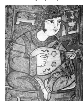
13. Muzyk grający na oud, malowidło z sycylijskiej Cappella Palatina, XII w.

hiszpańsku la ud ). Także przez Sycylię, którą w XI w. Normanowie odbili z rąk muzułmanów, następował przepływ muzyków arabskich, mauretańskich oraz bizantyjskich do Europy. Wśród bogatych XII-wiecznych malowideł w Cappella Pa-