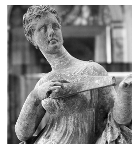
10. Grająca na pandurze, Tanagera (Grecja), III w. p.n.e.

Od IV w. również mieszkańcy cesarstwa wschodniorzymskiego (zwanego później bizantyjskim), uważający się za spadkobierców cywilizacji starożytnej Grecji i Rzymu,